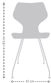
HOOGTE X BREEDTE